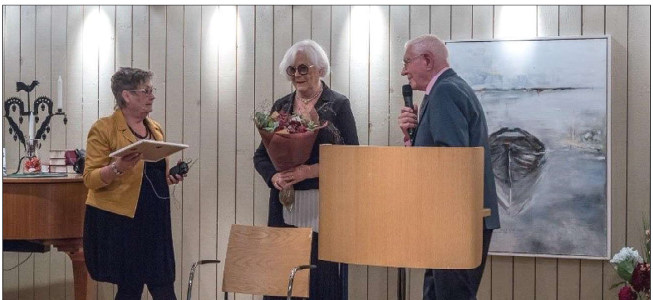
Uppvaktning av Länsföreningen vid jubileumsfesten