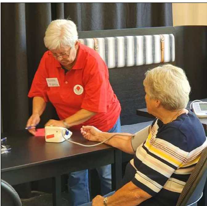
Blodtrycksmätning på mässan den 25 sept