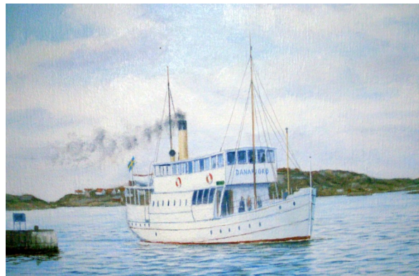
"Danafjord" ankommer Hönö. Foto på målning av Kjell Johansson

Näste da, reste Henning mä kvart over sju båden ifrå Hamnepirn å kom tebaggers mä fyrabåden på ättermeddan.