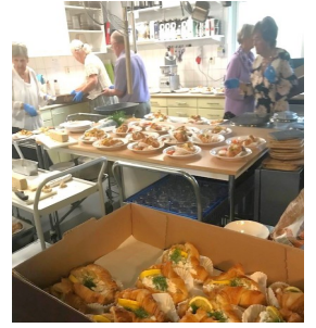
Förarbete i köket